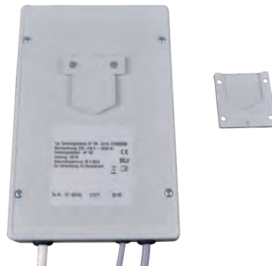
Abbildung 2: Wandhalterung